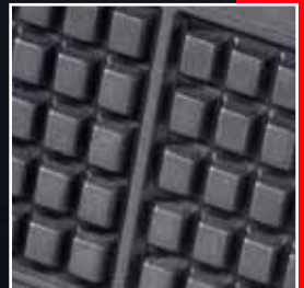
Handgefertigte Eisen- Guss-Platten (Unikat)