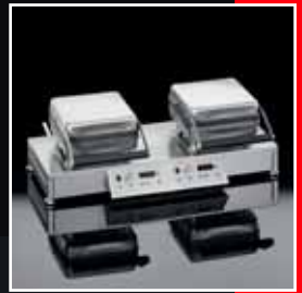
GTTPowerSave ® Back-Duo