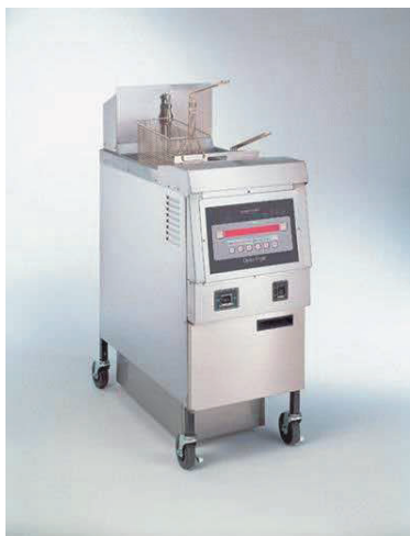
Offene Gasfriteuse 1x Einzelbecken OFG 321

Henny Penny bietet offene Fritteusen mit mehreren großen Frittierbecken, programmierbarem Betrieb, Ölmanagementfunktionen und schneller und einfacher Filterung. Die Gasfritteusen der Baureihe OFG 320 erreichen sehr schnell wieder ihre Betriebstemperatur und tragen wegen ihres Energiewirkungsgrades das ENERGY-STAR®-Kennzeichen. Die kurze Zeit der Temperaturerholung ermöglicht einen höheren Durchsatz, senkt die Energiekosten und verlängert die Nutzungsdauer des Frittieröls. Auf die robusten Frittierbecken aus rostfreiem Stahl wird eine 7-jährige Garantie gewährt – der längste Garantiezeitraum bei derartigen Produkten.