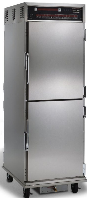
HHC 990 SmartHold Warmhalteschrank in voller Größe mit automatischer Feuchtigkeitsregelung

Die Warmhalteschränke SmartHold mit Luftfeuchteregeung von Henny Penny schaffen und erhalten ideale Bedingungen für das Warmhalten einer Vielzahl von heißen Speisen über längere Zeiträume vor dem Servieren.